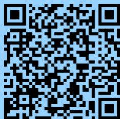
Studieninformationen Internationales Tourismusmanagement